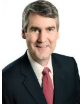
Stephen McNeil Nouvelle-Écosse