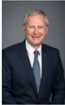
Blaine Higgs Nouveau-Brunswick