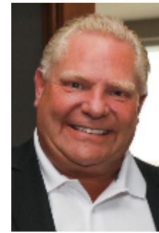
Doug Ford Ontario