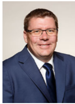
Scott Moe Saskatchewan