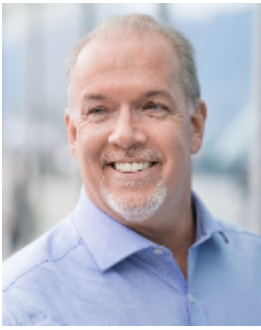
John Horgan Colombie-Britannique