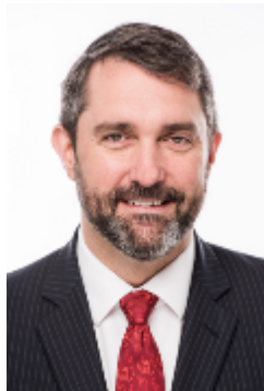
Sandy Silver Yukon