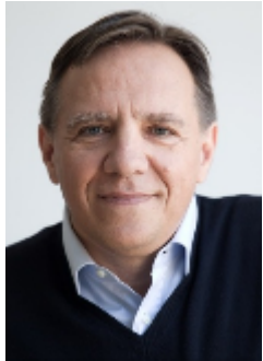
François Legault Québec