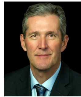
Brian Pallister Manitoba