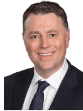
Dennis King Île-du-Prince-Édouard