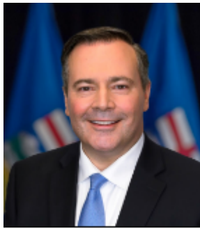
Jason Kenney Alberta